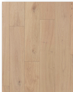
P132 Chêne Blanchi