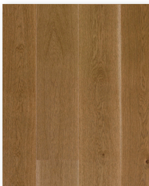
P157 Chêne Monarque