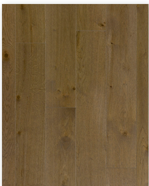
P169 Chêne Opale