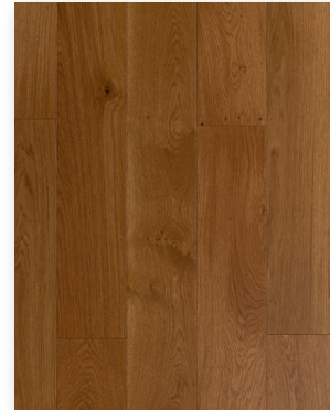
P300 Chêne Safari