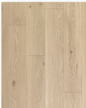
P122 Chêne Aurore