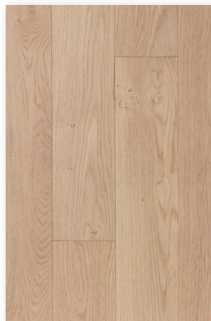
P132 Chêne Blanchi