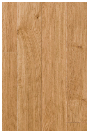
P131 Chêne Naturel